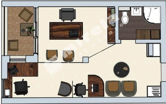
План мебели и напольных покрытий